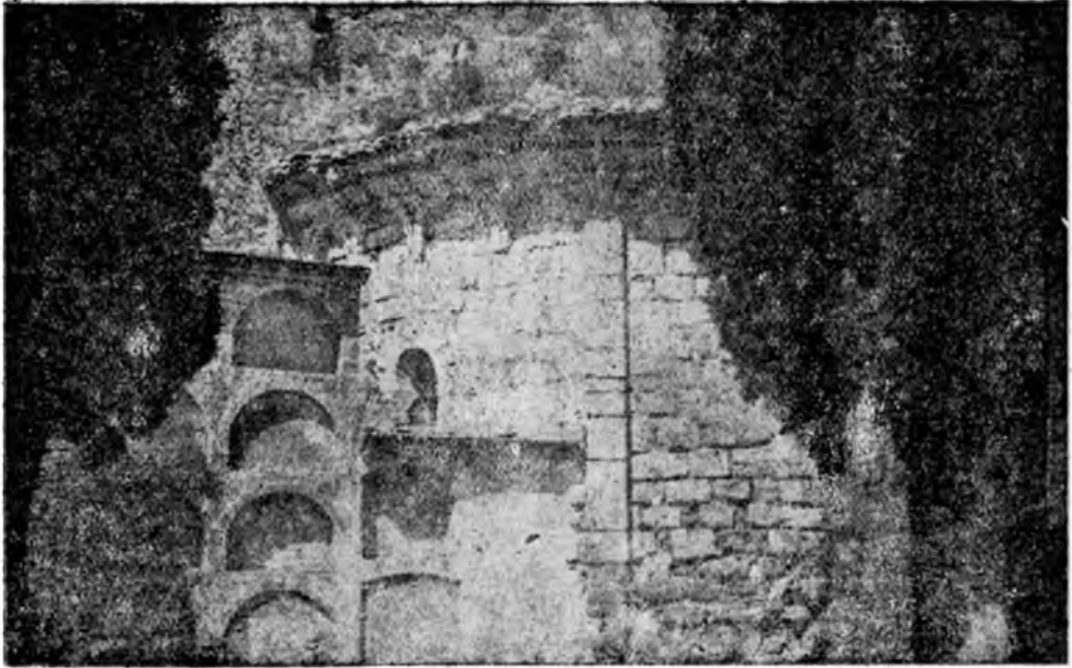
LÀM. I. — Castellví de la Marca: església de Sant Sadurní. a) Galilea. b) Absis amb arcuacions lombardes.